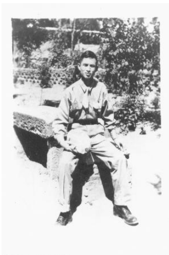
“北平五烈士”之一的石淳