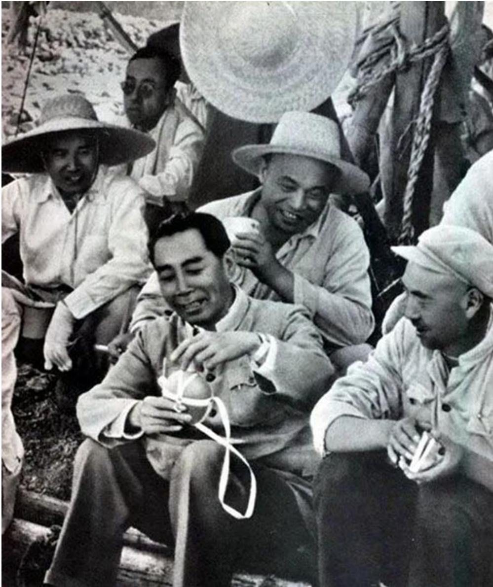
周恩来来到工地参加义务劳动，休息时与群众在一起。

批评和自我批评。 毛泽东是批评和自我批评作风的坚定倡导者和忠实实践者。1962年召开的七千人大会上，针对此前中央和地方工作中出现的失误，毛泽东指出：“凡是中央犯的错误，直接的归我负责，间接的我也有份，因为我是中央主席。”透过如此毫不隐晦的自我批评，可以看到老一辈革命家身上勇于担当、善于负责之勇气，敢于正视错误、改