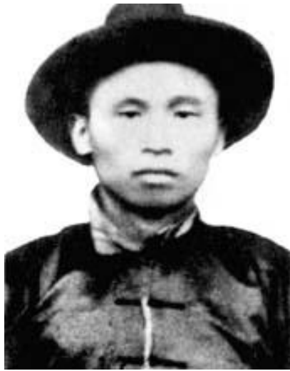
江岸京汉铁路工会委员长林祥谦

在福州市区南郊的闽侯县祥谦镇，一座庄严肃穆的烈士陵园背倚青山、面朝碧水。苍松翠柏环绕间，陵园大门处矗立着一座花岗岩雕像：一位青年工人站得笔直，泰然自若，双手抱于胸前，目光坚毅地望着前方。